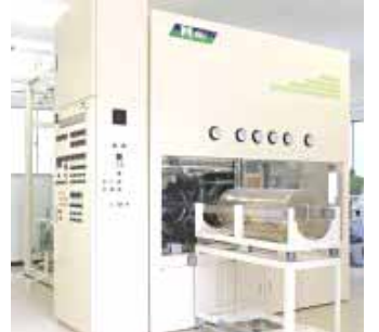
写真：装置の中でCO2が汚れを落とす

衣替えにクリーニングはつきもの。仙台のタカノというクリーニング屋さんには二酸化炭素CO2を装置で加熱「超臨界状態」にして秒速360℃で汚れを洗剤を使わず落とします。東北大学の超臨界溶媒工学研究センターにCO2でクリーニングをする装置があると聞き新井教授と開発したそうです。CO2のほとんどを回収して再利用するので大気中に放出する心配が少ないエコクリーニングの時代の幕開けを予感させます。