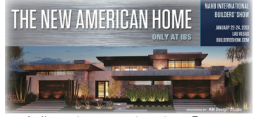
実際の住宅は地下1階+3階の4層である