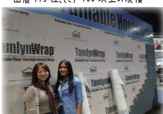
透湿、防水ハウスラップのコーナーで（塩田）