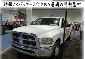
動くオフィスとして機能する作業車の展示