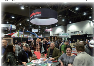
出展 915 社、セミナー100 以上の規模