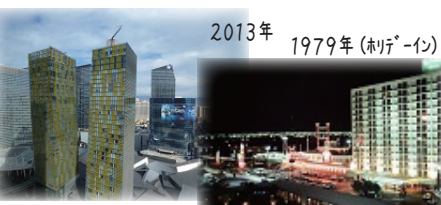
2013年 1979年(リデイン) ホリデーインの跡地に シティセンターとカジノのないマンダリンホテルが建設された