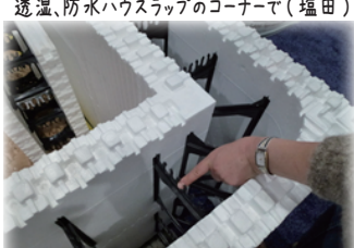
効率よくパッケージ化された基礎の断熱型枠