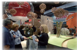
会場はラスベガス・コンベンションセンター