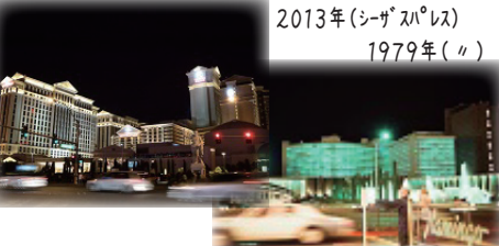
2013年(シーザスパレス) 1979年(リ)

ラスベガスのホテルは全米で最も優秀な建築家とアーティストの仕事によって造られている。消費者の立場で空間を楽しみ、同時に空間造りのヒントを沢山学んだ。'79大学時代に初めて訪れ驚嘆したものだが、改修を繰り返した老舗のシーザスパレスは30余年経過し今なお熟成し魅力を放ち続けていた。大竹喜世彦