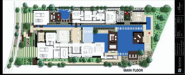
ゴルフコースが隣接する住宅地