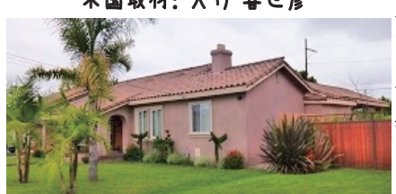
米国取材：大竹 喜世彦

する「リンドー」形のもの、行基瓦のようなS型の2種類が使われていること。第2の特色は、開口部(扉と窓)で上方が半円形になったもの、長方形の扉や窓の場合でも欄間や底を設け、額縁飾りを豪華に造る装飾がこの建築様式の特徴です。20世紀になり1915年パナマ・カリフォルニア博覧会がサンディエゴで開催されました。各パビリオンの共通デザインに「スパニッシュコロニアル」が採用され、スパニッシュ・エクレクティック様式とも呼ばれました。