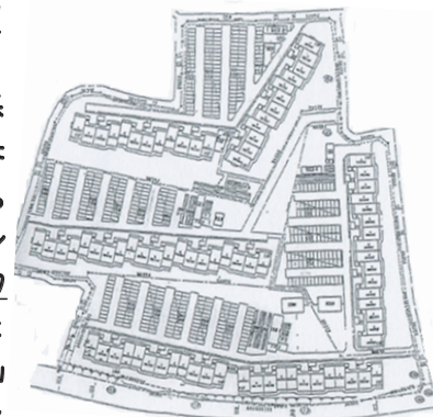
★マークスプリングスの最終的な都市計画は右図が採用された(渋谷Design Studio 録画)

「米国に倣うスピーディーな計画」 東京・町田ではプログラミング(配置計画)担当者が、分譲地内の道路付け、出入口、公園や公共施設等々を建築基準法の条件の中で、販売面積を如何に最大効率で算出する仕事に入りました。一方、全体計画を担当するマスタープランナーと効率だけでなく、感度の高い本格的な街づくりの折り合いを付けるか?景観と建物のデコレーションに拘るばかりの計画では事業が成立しません。その調整はディ