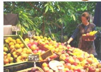
↑植物に囲れた環境でBIO食品販売

P 地域循環する食品と再生エネルギー 冷蔵庫と輸送距離に厳しいエネルギー規制があるヨーロッパでは【コンビニ】はありません。このBIO認定スーパーは隣で平飼する家畜、野菜→販売→売れ残りは廃棄せず肥料という食料の地域循環を行っています。地域農家と交わすフェアトレードは、農家の生活を守っています。配達は地域で回収した食用廃油で走るバイオカーです。断熱は地域のワラと屋上緑化。地下水&地熱&排熱&屋上ソーラーコレクター(太陽熱回収)を冷暖房に利用し自社ソーラー電池と地域のエコ電力で従来の1/10のエネルギーで運営する店内は緑化され、まるで植物園のよう。