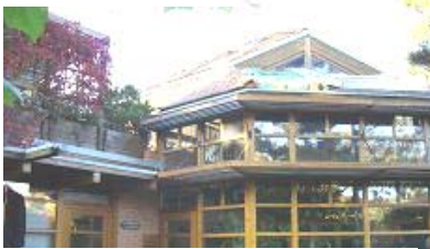
↑2階テラスから雨水を取水し再利用 ↓地域暖房の燃料に間伐材を活用

ジードルンク(戸建団地)は再生エネルギーで自立循環しているが、一部エコ電気(風力・ソーラー発電)を購入している。近隣農家の屋根ソーラーは、農家が豊かになった訳ではなく、実は有料で地域住民に屋根を貸している姿だ。