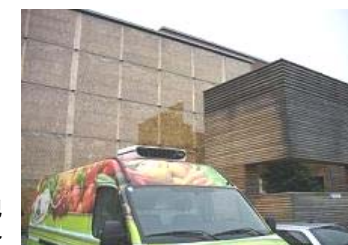
↑ワラ断熱の建物、廃油で走るバイオカー

大食いタレントや芸能人の料理ショーの多さに圧倒され日本の飽食が象徴されたと感じます。豪華さと安さを追及する食生活は、とりわけ世界中の貧しい国の農家や住民を苦しめ水資源や環境を破壊しているという事実もあります。日に一度温かい食事があれば、大したものでもなくとも【御馳走(ディナー)】と呼べる欧州の質素さと簡潔さを知ると、簡単な食事であっても、家族それぞれが大いに語り、1時間ぐらいかけるのもよい点だと思います。欧米以上に飽食化した日本。考え直す時期ですね。