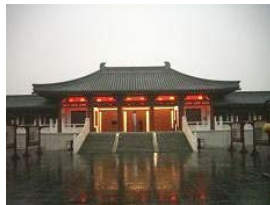
伝統の四合院建築にも人工降雨が...

西安： 秦、漢、隋、唐など13の王朝が、1100年に渡って都をおいた古都長安です。シルクロードの出发点で、唐代は東西の行き交う、世界最大の国際都市でした。日本から遣隋使、遣唐使を受け入れ、現在も京都・奈良市と友好都市の関係にあります。