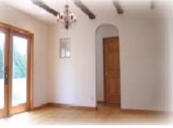
都市化と深刻な水不足...