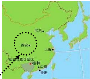
取材：(株)アップル 大竹清彦

西安に建築視察で出かけた私は、【人工降雨】を偶然にも体験。農耕のための60日ぶりの雨は、風もなく異様な霧雨でした。環境問題＝CO2、地球温暖化と考えがちですが、世界は【水問題】が急務です。それは人類の【食糧問題】と直結しているからです。水量不足は同時に【汚染】をもたらす安全には使えません。安全を最優先するEU諸国では、残留農薬や有害物質が検出されると即座に全面禁輸です。一方の日本はなかなか禁輸となりません。安く大量にスーパー、レストランで販売されます。農作物の農薬や魚介類、鮮ネタの重金属汚染も非常に心配です。水に関わる環境問題は輸入の多い水大国日本も無関心でいられない事実です。