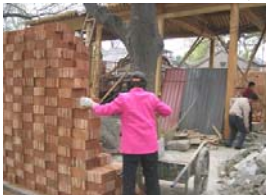
住民の改築もむなく...