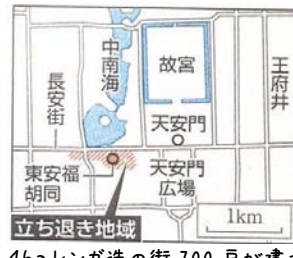
4haレンガ造の街 700 戸が建つ

北京中心に残る【胡同】はモンゴル語で【井戸】を意味します。歴史700年の街は世論を背景に消滅の危機を逃れ、漢族1500人の生活は守られたかに見えました。...これは私が視察した昨年の今頃の話です。ところが、10月の【建国60周年・軍事パレード】を美しく演出し長安街を拡張するための強制撤去が、この春、突然言い渡されました。中国の伝統的な四合院建築と胡同の光景は残念ながら消滅します。北京には、日本の四国ほどの面積に現在1500万人の人々が暮らしています。高層マンションが人口爆発を吸収しますが、【水不足】は止みません。遙か数千キロ前から北京に水を運んでいます。深刻化する水不足の主因は農工業の【大量取水】ですが、中国だけの問題でしょうか。実は、ここにも私たちが何気なく買う輸入が深く関わっています。大量の水を使う農作物は、私達が間接的に使う【仮想水】という新しい観点で考え消費する時代に来ています。取材：(株)アップル大竹清彦