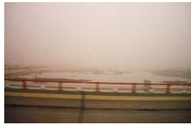
渭川は大河川黄河の支流 西安発展の要であった...