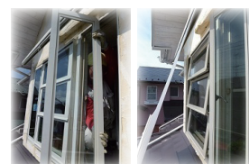
イイね! 通風する出窓へ交換

『春一番』は「黄砂」だけでなく、「PM2.5」という大気汚染物質まで運び、マスクをした人たちが増えました。日中は初夏の陽気を感じさせ、窓を開け放して室内の空気を入れ替えたい季節になってきましたが、花粉症も含め「自分の意志で外気をシャットアウト」出来る窓も省エネ以外で重要なポイントになってきましたね。Apple.Eco