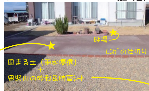
固まる土(雨水浸透)