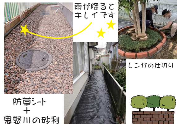
雨が降ると キシイです