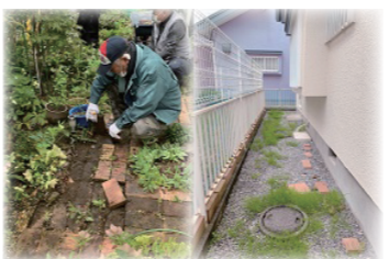
草取りが大変な花壇と園路