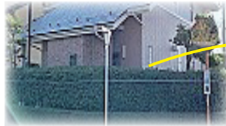
植栽で二段になっている生垣、剪定が大変でした。