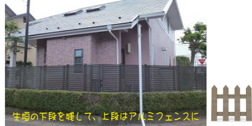
生垣の下段を壊して、上段はアルミフェンスに