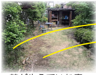
芝が生えていた庭