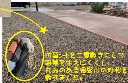
メッシュ敷き工事

防草シートを二重敷きにして 雑草を生えにくくし、 丸みのある鬼怒川の砂利を 敷きました。