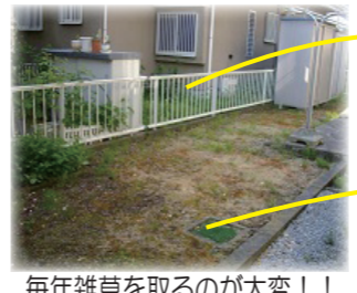
毎年雑草を取るが大変!!