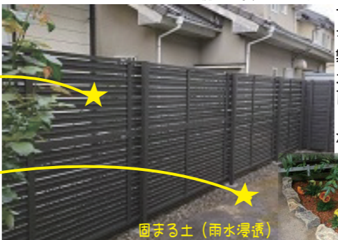
固まる土(雨水浸透)

古くて細いフェンスから 丈夫なフェンスへ交換 雑草の生えない固まる 土を施工。園路には 瓦の再生チップを敷き しこが色を庭に取り入 れました。