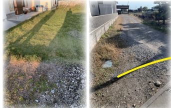
毎年雑草取りが苦難