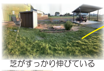
芝がすっかり伸びている