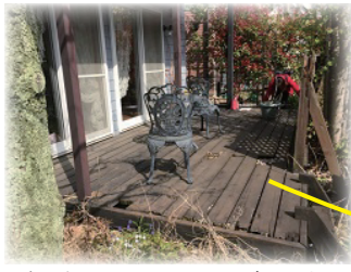
朽ちたウッドデッキ